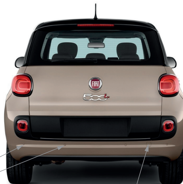
foto č. 2 - pohľad zozadu