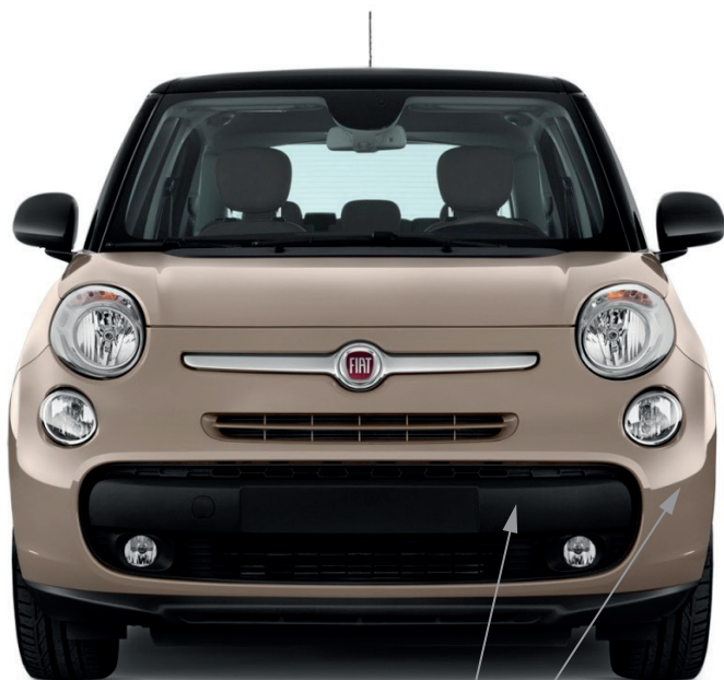
foto č. 1 - pohľad spredu