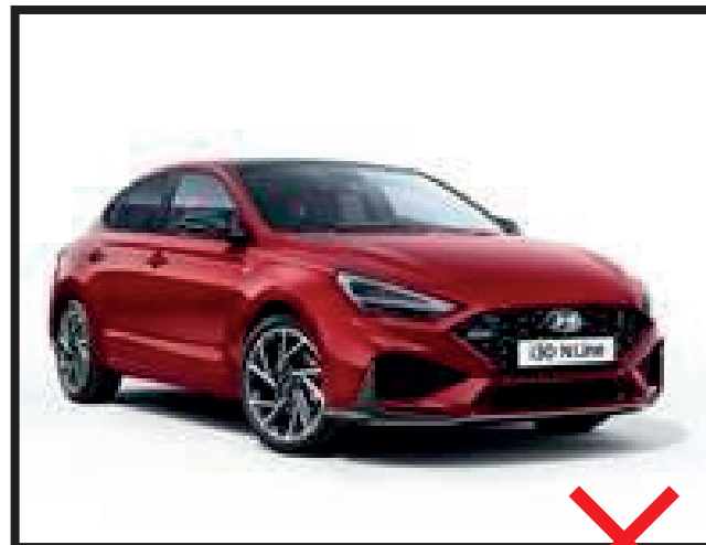
promo foto z internetu