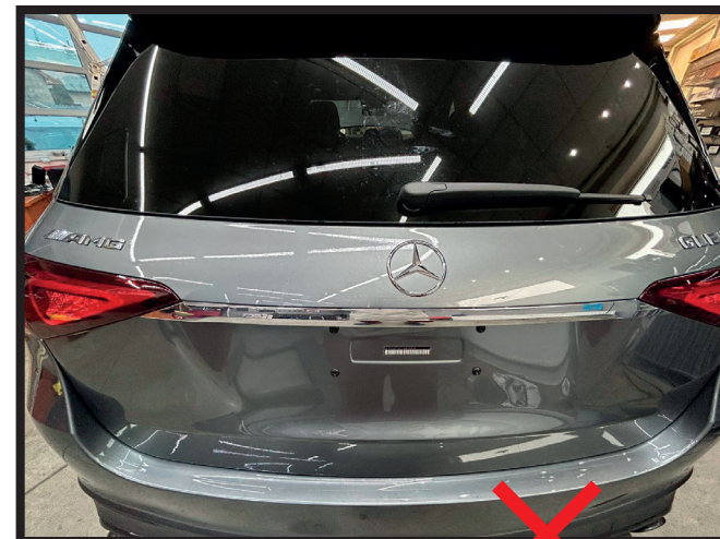
neúplne viditeľné časti auta