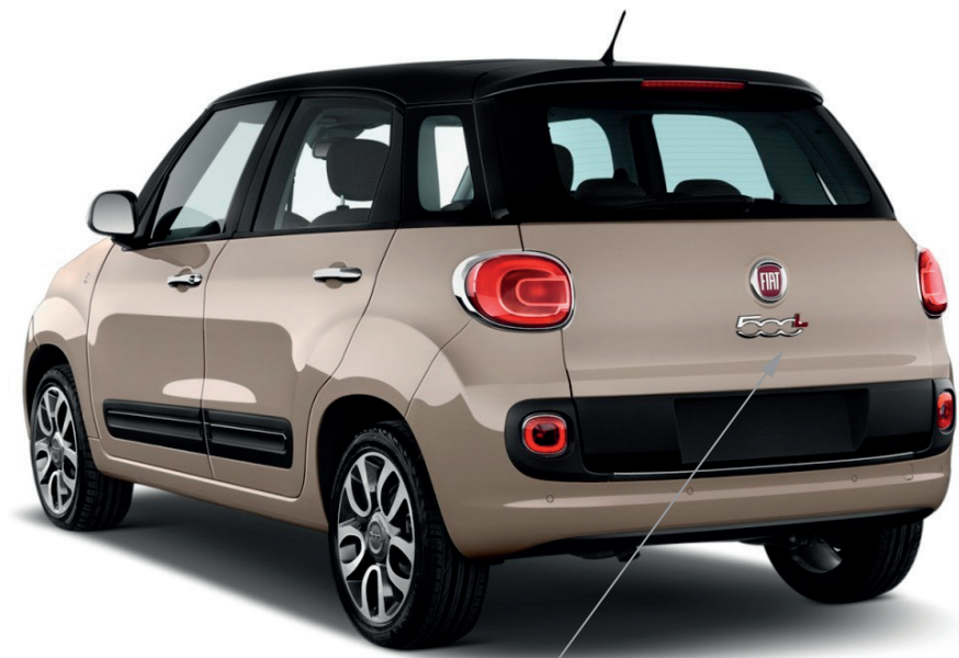
foto č. 4 - 3/4 pohľad zozadu

označenie modelu auta / 4x4 / motorizácia...