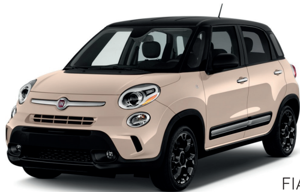
FIAT 500L Trekking