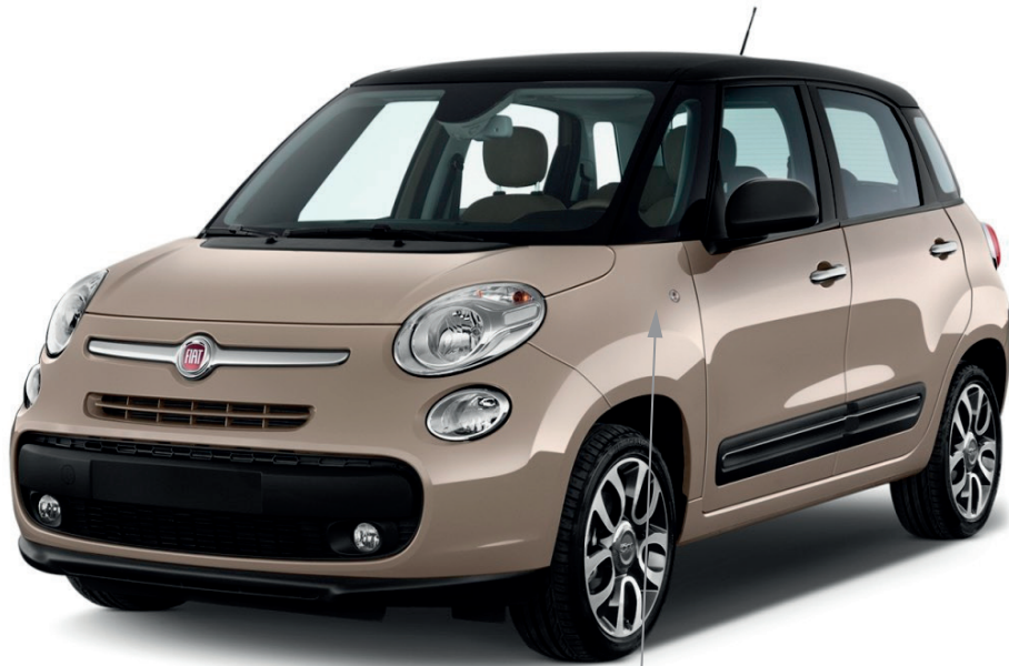
foto č. 3 - 3/4 pohľad spredu

má/nemá doplnkové označenie modelu auta/plakety...